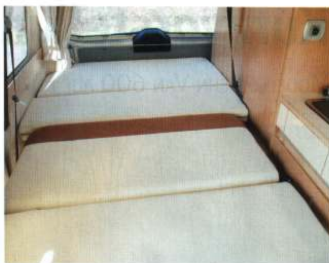
■ Mit einer Liegefläche von 205 x 125 cm haben zwei Erwachsene auch bei eingefahrenem Dach Platz zum Schlafen.