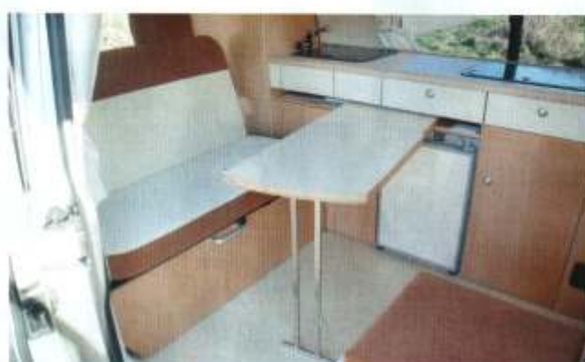
■ Eine typische Dipa-Lösung ist der aus dem Küchenblock ausschwenkbare und verschiebbare Esstisch. Bei ganz nach hinten geschobener Bank hat ein Hocker vor dem Tisch Platz, nach vorne geschoben dient der drehbare Beifahrersitz als Sitz am Tisch.