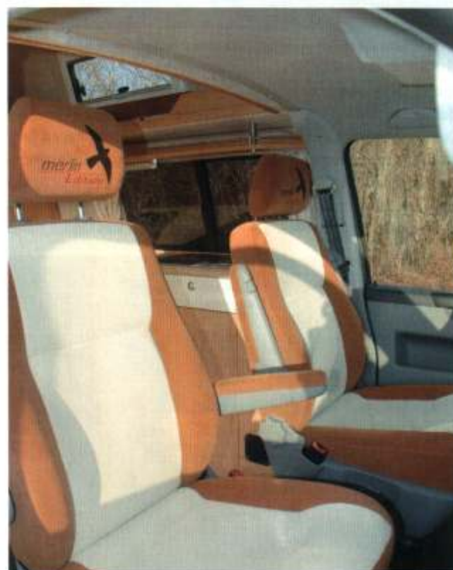
■ Zweifarbige Sitzbezüge im Dessin der Wohnraumbank auf den höhenverstellbaren Edition-Sitzen mit Lendenwirbelstütze und Armlehnen. Der Beifahrersitz kann in den Wohnraum gedreht werden.