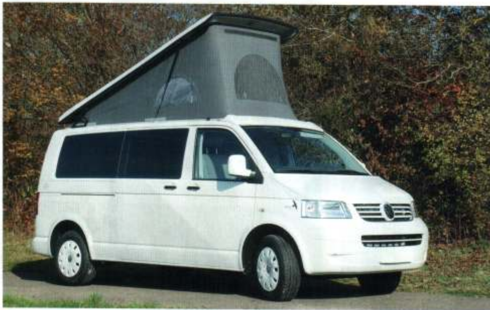
■ Der Dipa Merlin Edition mit Aufstelldach passt mit seiner Höhe von 202 cm in jede Normgarage. Mit aufgestelltem Dach bietet er zwei Doppelbetten.