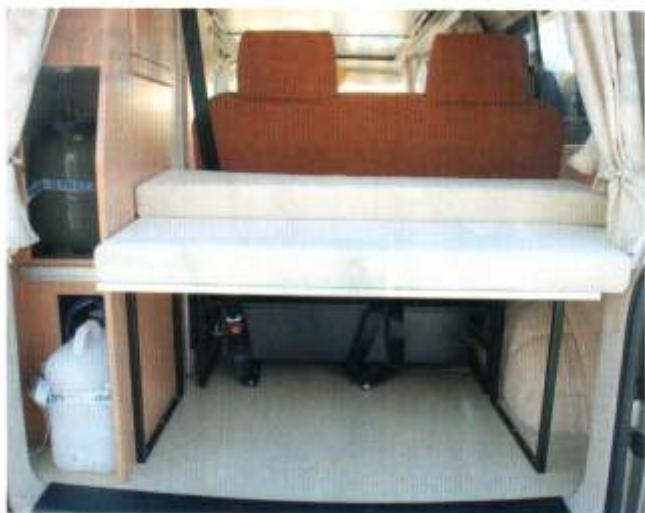
■ Der Stauraum unter der Liegefläche bietet 480 Liter Platz. Im seitlichen Kleiderschrank sind die zwei Gasflaschen und zwei Wasserkanister leicht zugänglich untergebracht.